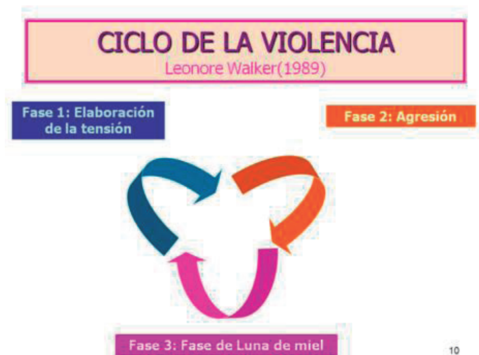
Imagen Mariangeles Álvarez García

Este ciclo varía en intensidad, duración y frecuencia, pero con el tiempo el intervalo entre etapas se hace más corto.